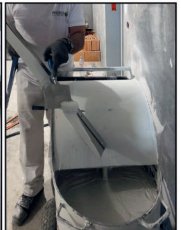
Überschuss wird wieder zugeführt