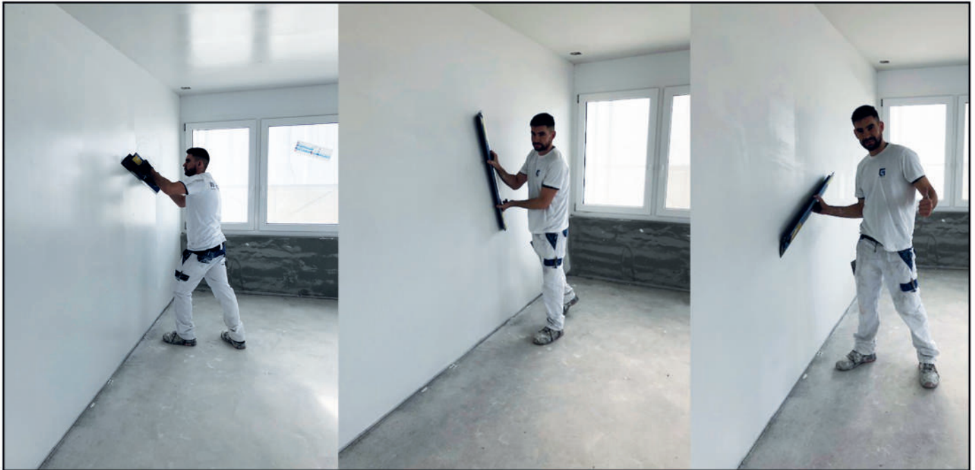
Abziehen, glätten und verdichten einer applizierten Wandfläche auf Qualität Q3 bis Q4